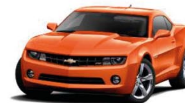
INFERNO ORANGE METALLIC