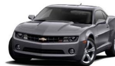
CYBER GRAY METALLIC