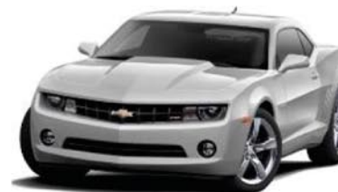
SILVER ICE METALLIC

Irrtümer nicht ausgeschlossen · Weglassen technischer Daten vorbehalten · S = STANDARD · 0 = OPTIONAL · -- = NICHT BESTELLBAR