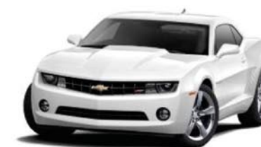
SUMMIT WHITE Interim availability