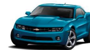
AQUA BLUE METALLIC Not available on SS