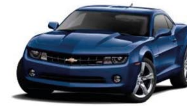
IMPERIAL BLUE METALLIC Not available on SS