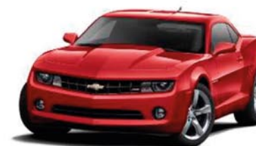
RED JEWEL TINT COAT Extra-cost color