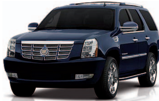
Blue Chip Metallic