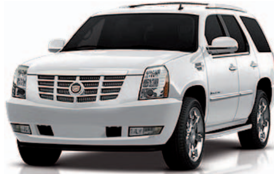
White Diamond Tricoat