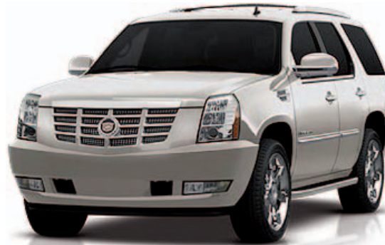
Gold Mist Metallic